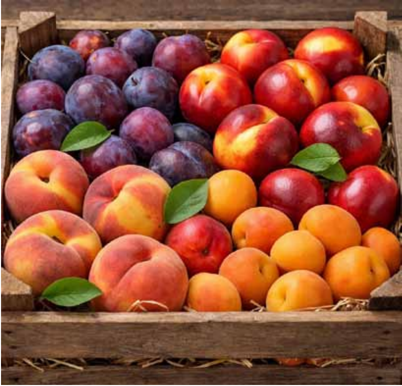
Ciruelas, duraznos, damascos y nectarines, frutas que podrían ser exportadas a China. /A

El recorrido incluyó huertos, empaques y otras instalaciones ubicadas en las provincias de Buenos Aires, Mendoza, Río Negro y Neuquén, donde se evaluaron los sistemas de manejo sanitario y de inocuidad, el control de plagas de interés cuarentenario para China, la trazabilidad de los productos, los procesos de acondicionamiento y la documentación de respaldo. Además, se visitaron las instalaciones del laboratorio nacional de referencia del Senasa, donde los técnicos observaron las actividades vinculadas al diagnóstico y determinación de plagas vegetales. La gestión y coordinación de la actividad contó con el apoyo y la coo-